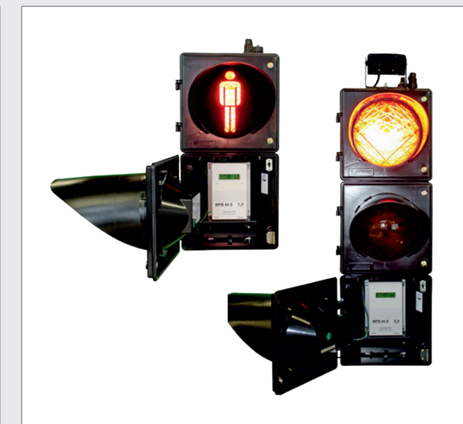
MPB 44 S Signalgeber zur Regelung von Fußgänger- und Fahrbahnverkehr mit eingebauter Steuerung und Schaltenteil 42/12 Volt.