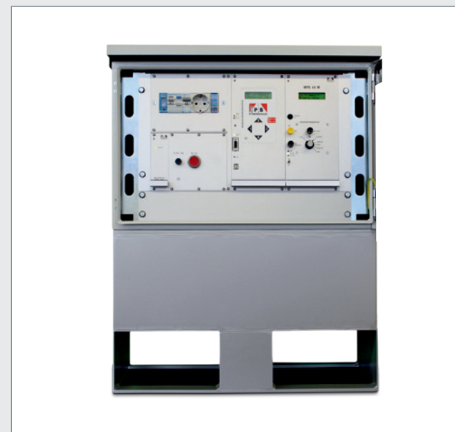
Das kompakte Master-Steuergerät MPB 44 M/S steuert bis zu 12 Signalgruppen an und versorgt zudem alle MPB 44 S-Ampelsignalgeber zentral mit Betriebsspannung in 42 Volt-Technik.

Möchten Sie wissen, wie Sie Ihre bereits schon vorhandenen MPB 4400-Ampelanlagen in das neue MPB 44 M/S-System einbinden können? Wir beraten Sie gerne. Bitte fordern Sie Ihr individuelles Angebot an.